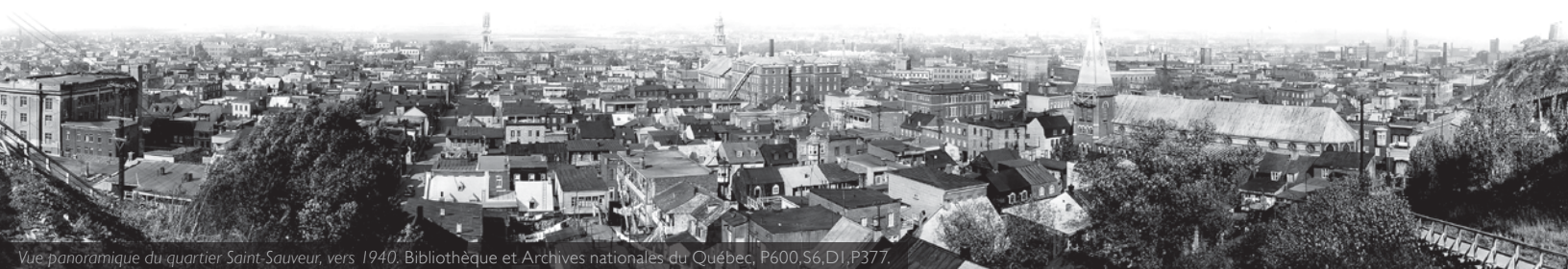
Vue panoramique du quartier Saint-Sauveur, vers 1940. Bibliothèque et Archives nationales du Québec, P600.S6.D1.P377.

Rendez-vous sur le site www.editionszeme.com pour en savoir davantage.